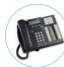
Nortel T7100 T7208 T7406 T7316