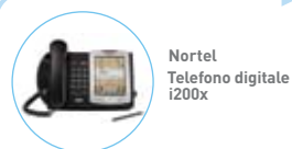
Nortel Telefono digitale i200x